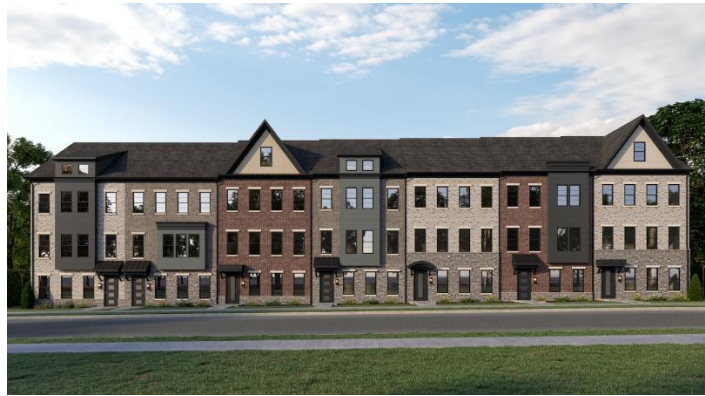
ตัวอย่างทาวน์โฮมที่ใช้ผนังอาคารร่วมกัน

การอยู่อาศัยร่วมกันกับเพื่อนบ้านอย่างสงบสุขถือเป็นสิ่งที่บุคคลส่วนใหญ่ปรารถนา แม้ผู้คนจะสามารถเลือกที่อยู่อาศัย ไม่ว่าจะ เป็นลักษณะของบ้าน พื้นที่ หรือทำเลที่ตั้งได้ตามความต้องการของตนเอง แต่อย่างไรก็ตาม เราไม่อาจเลือกเพื่อนบ้านได้ ซึ่งอาจส่งผลกระทบต่อคุณภาพชีวิตในการอยู่อาศัยโดยตรง ในกรณีของที่อยู่อาศัยประเภททาวน์โฮมหรืออาคารพาณิชย์ ซึ่งมีลักษณะการใช้ผนังร่วมกันระหว่างอาคาร การดำเนินการซ่อมแซมหรือตกแต่งอาคารในส่วนดังกล่าวจึงอาจก่อให้เกิดผลกระทบต่อเจ้าของอาคารข้างเคียงได้โดยง่าย ด้วยเหตุนี้ การดำเนินการใด ๆ ที่เกี่ยวข้องกับผนังร่วมจึงควรเป็นไปด้วยความระมัดระวัง และมีการแจ้งให้เจ้าของที่ดินหรืออาคารข้างเคียงทราบล่วงหน้า